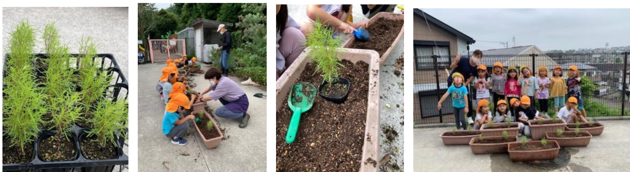
【マリーゴールド 配布】 2022.6.19 色鮮やかなマリーゴールドが個人宅に配布されました