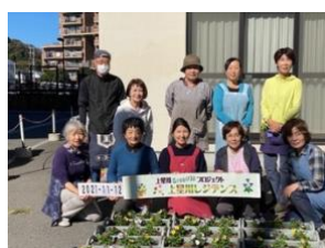
【ハンギングバスケット講習会】2021年12月3日 毎年恒例のハンギングバスケットも今年で7回目。ピオラ・葉牡丹を使ったハンギングバスケットは街を明るくしてくれると大好評。